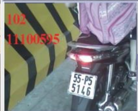
Bốt kiểm soát xe máy