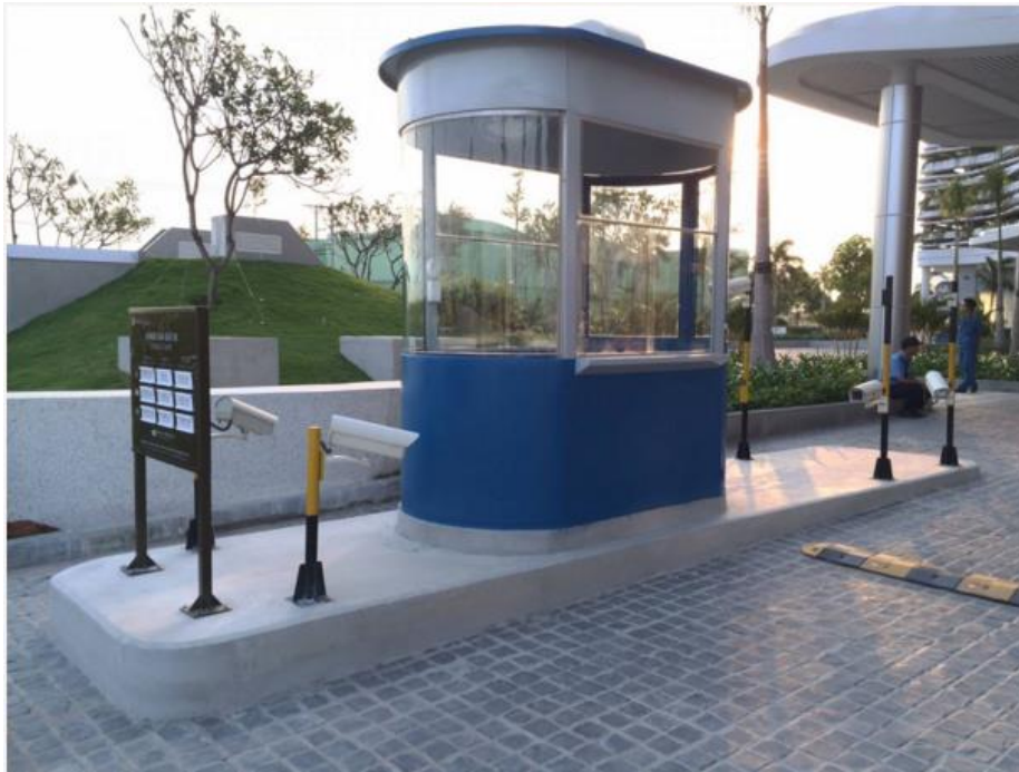
Bốt bảo vệ kiểm soát lối vào ra bãi giữ xe